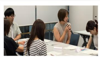
7/26 グループワーク 発表の様子