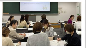
11/8 グループワーク の様子