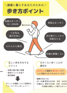
学生が作成したリーフレット