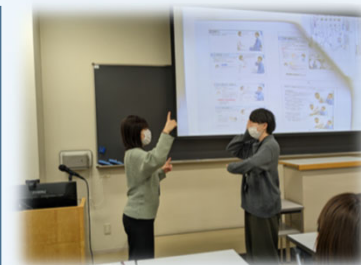
対面開催： 脳神経PA演習の様子

⇒患者への看護実践につながる新たな知識を得るなど，技術の学び直しとともに，職場で他職員への指導・共有など学びの還元に結びついていた。