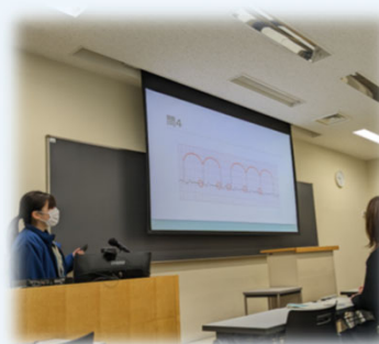
対面開催：心電図講義・演習の様子